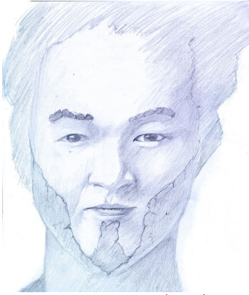
Le Choeur, design crayon

débarrasser du passé en oubliant qu'il est également une source intarissable d'informations, ce qui nous pousse à refaire les mêmes erreurs, génération après génération.