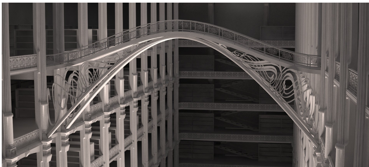
Design 3D non texturé de la salle centrale de la Bibliothèque