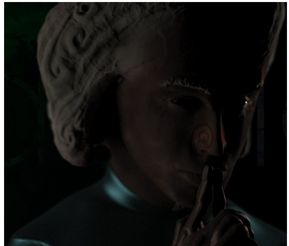
Tradition, modèle 3D

Dans le design des personnages, il y a une question de métissage également, peut-être inconsciemment pour que les personnages me ressemblent, mais surtout pour qu'ils ne soient pas soumis aux archétypes standards, pour qu'ils se conforment au mélange des genres qui par nature est à l'origine d'Allégorie.