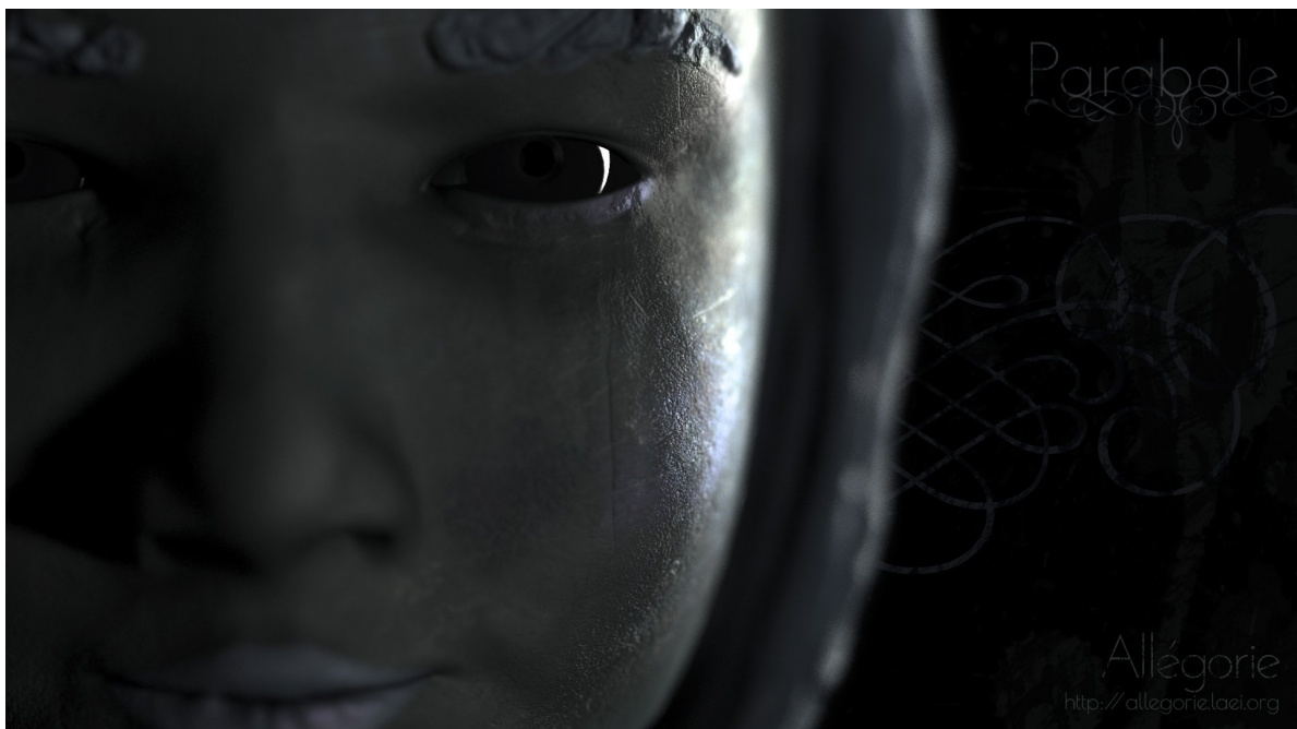
Modélisation 3D de Parabole

La Bibliothèque sombre doucement dans l'obscurité. Dialectique vient de disparaître et Parabole part à sa recherche pour découvrir à ses dépens que le monde n'est pas confiné à la Bibliothèque et que la lumière existe, par de là ses murs... Mais pour l'atteindre, il lui faudra mourir, questionner son propos, accepter de ne plus être celle qu'elle croyait être et confronter l'attitude macabre de Modernité.