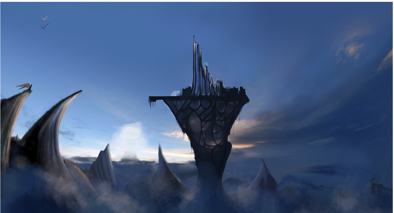
Illustration de la cité, speed-painting numérique

Le monde est divisé en trois, un peu à la façon de la seconde topique Freudienne, avec son conscient, préconscient et inconscient ; là le monde est divisée entre la Bibliothèque (le Léviathan, le contrat social , où règne Équilibre), La Cité (Autonomos, la ville de construite par Raison) et le Jardin des Sentiments, à la base, sous les nuages.