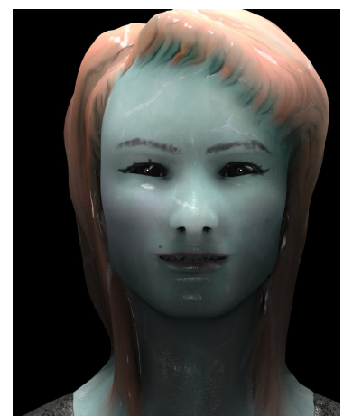
Modélisation 3D de Modernité

Le rôle de Modernité, comme méchant d'Allégorie, vient clairement de C.S. Lewis. Modernité est un personnage complexe à définir, le propos n'étant pas d'en faire un méchant manichéen, mais bien un caractère à part entière. Étant personnellement allergique aux vilains en tant que simples antagonistes aux personnages héroïques, je me suis senti obligé de faire un antagoniste bien pensant, pas fermé mais dont les actes déplacés finissent par s'accumuler et prendre des proportions cataclysmiques. C'est également ma vision du modernisme, cette envie de se